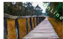
USLAR - 06.03. 07.03.21 - USLAR

Das Seminar wird online angeboten und bietet hier ganz neue Einblicke in die Möglichkeiten der Onlineaufstellungen.