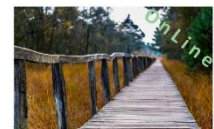
USLAR - 06.03. 07.03.21 USLAR

Das Seminar wird online angeboten und bietet hier ganz neue Einblicke in die Möglichkeiten der OnlineAufstellungen.